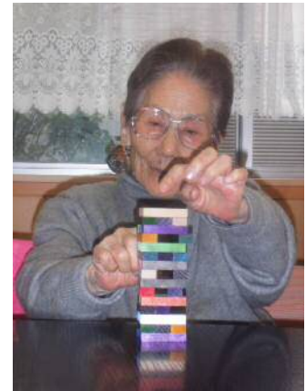
手芸活動の楽しさ