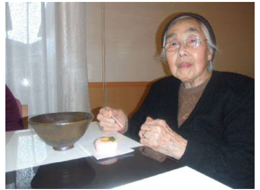
心が休まるお抹茶の時間